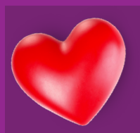
Welzijn & Welbevinden