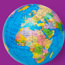
Immigratie en integratie