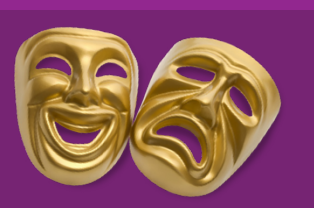
Cultuur en (Social) Media