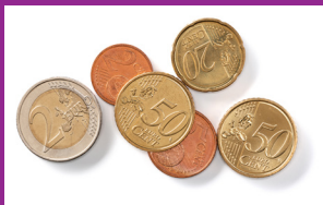
Koopkracht & Inkomen