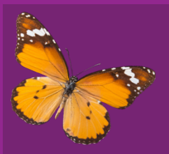
Milieu, Klimaat & Duurzaamheid