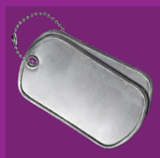
Defensie & Internationale Veiligheid